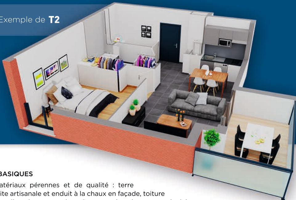
Exemple de T2