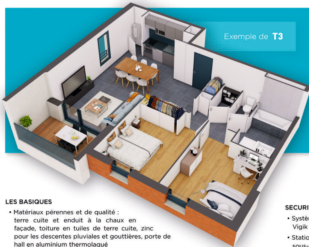
Exemple de T3