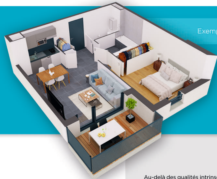
Exemple de T2